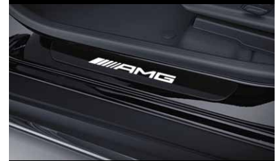
AMG Wechselcover für beleuchtete Einstiegsleiste, vorne, 2-fach