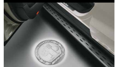
LED-Logoprojektor, AMG Wappen

2-teiliges Set. Für die Ausstiegsleuchten in den Seitentüren.