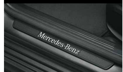
Wechselcover für beleuchtete Einstiegsleiste, vorne, 2-fach

Schwarz mit weißem Mercedes-Benz Schriftzug und Pattern.