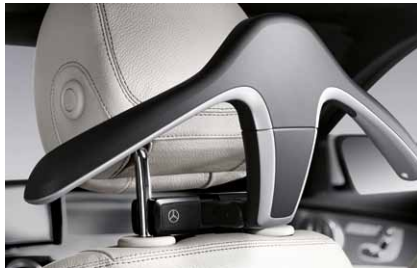
Kleiderbügel, Style & Travel Equipment

Faltenfrei ankommen mit dem ebenso eleganten wie praktischen Kleiderbügel. Zur einfachen Montage an der Fahrer- bzw. Beifahrer-Kopfstütze.