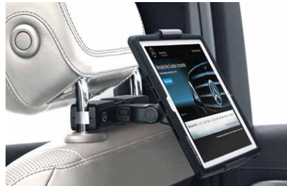
Halter für Tablet PC (Kopfstütze), Style & Travel Equipment

Der Basisträger (A000 810 3300) ist ein für die Montage zwingend benötigtes Zusatzteil.