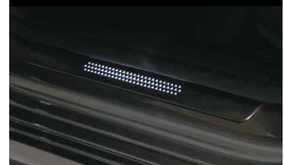
Wechselcover für beleuchtete Einstiegsleiste, vorne, 2-fach