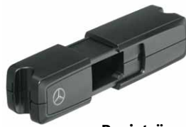
Basisträger 39 €* A000 810 3300

Die Kopfstützelemente können einfach angeschlossen und entfernt werden. Das modulare System basiert auf einem Basisträger, dieser kann durch das Produkt Ihrer Wahl – Kleiderbügel oder Halter für Tablet PC – erweitert werden.