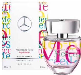
Pop Edition, Eau de Parfum